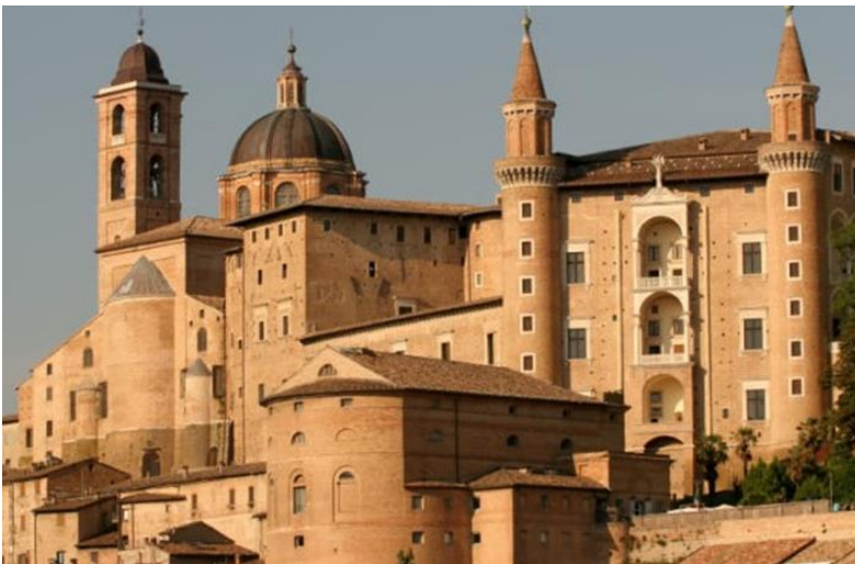
Der Herzogspalast in URBINO geplant und errichtet in weiten Teilen vom Architekten Luciano LAURANA aus Dalmatien

URBINO , das Städtchen am Metauro, wird in dieser Zeit ein Zentrum der Renaissance, - zur idealen Stadt, zum Licht Italiens Unsterblich wird die Stadt allerdings erst durch das Werk Baldassare CASTIGLIONES: IL CORTIGIANO