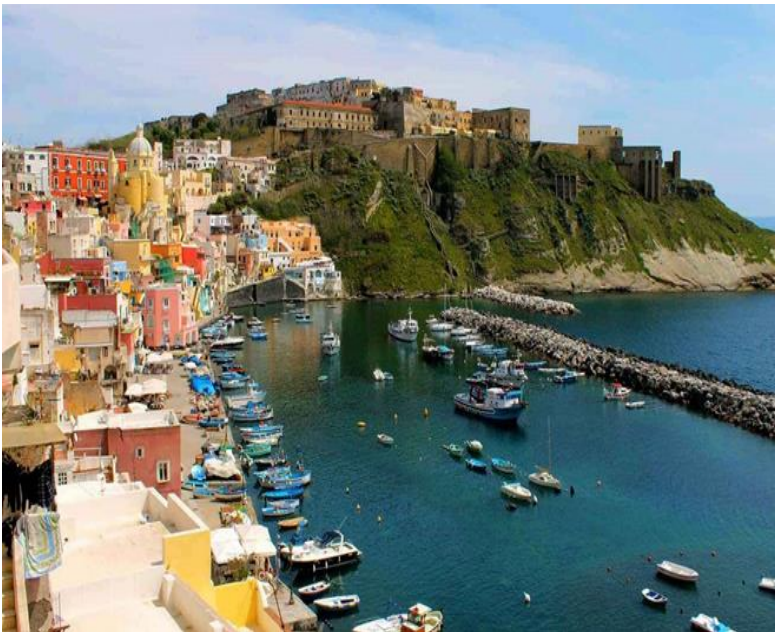
L'isola di PROCIDA