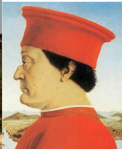
Das berühmte Porträt von Federico von Montefeltro von Piero della Francesca